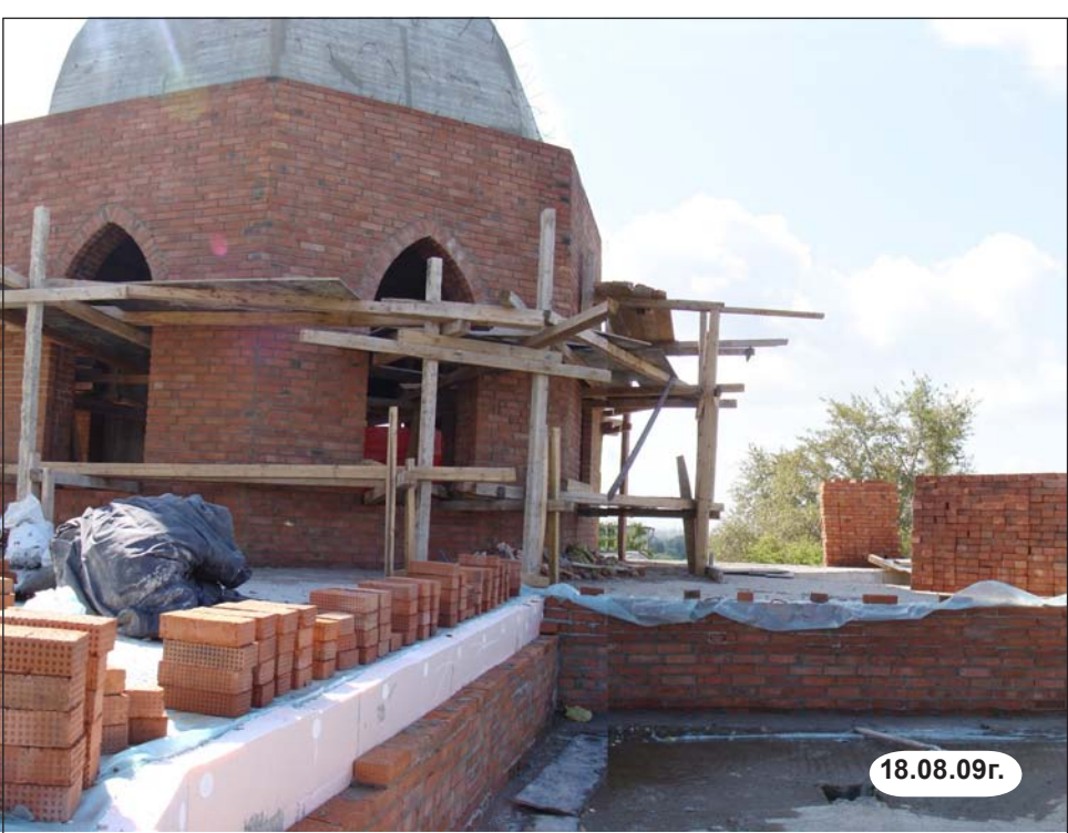
Обкладка кирпичем с утеплением фигурной бетонной балки от промерзания потолка мечети.