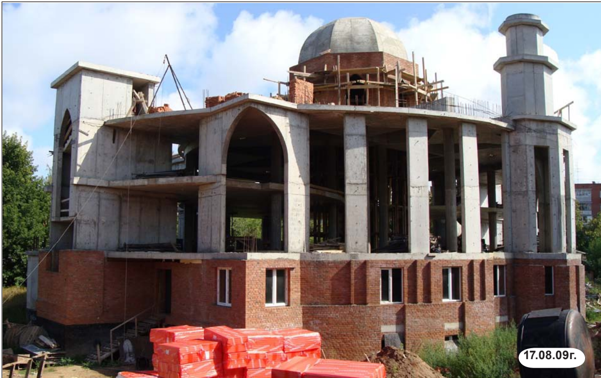
Строительство мечети по ул.К.Маркса в г.Ижевске