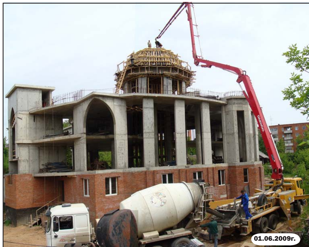
Заливка бетоном купола мечети.

Для выполнения запланированных работ, если получится иншаа..., нужно собрать не менее 5млн.руб. Эта сумма без учета строительства двух минаретов.